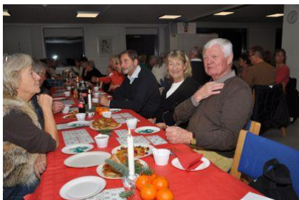
Julebanko er et tilløbsstykke

Det hyggelige julemøde med mulighed for at vinde juleanden og den store gavekurv samt mange andre gode sager.