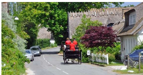
Foto fra et senere besøg af prins Henrik ud for Sørupvej 35