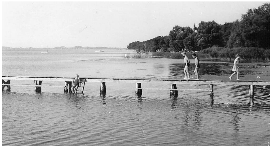
dateret ca. 1935.