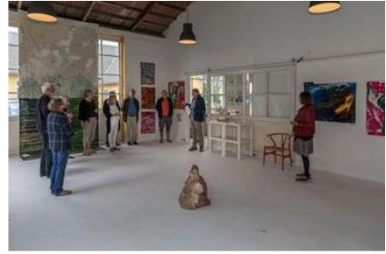
Galleri Ewald, Møn