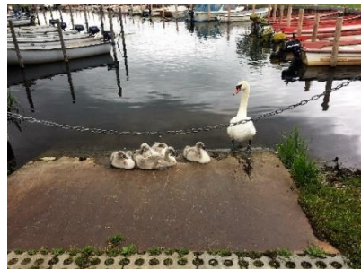
Idyl ved slæbestedet

Resultatet taler for sig selv – der er blevet flot overalt.